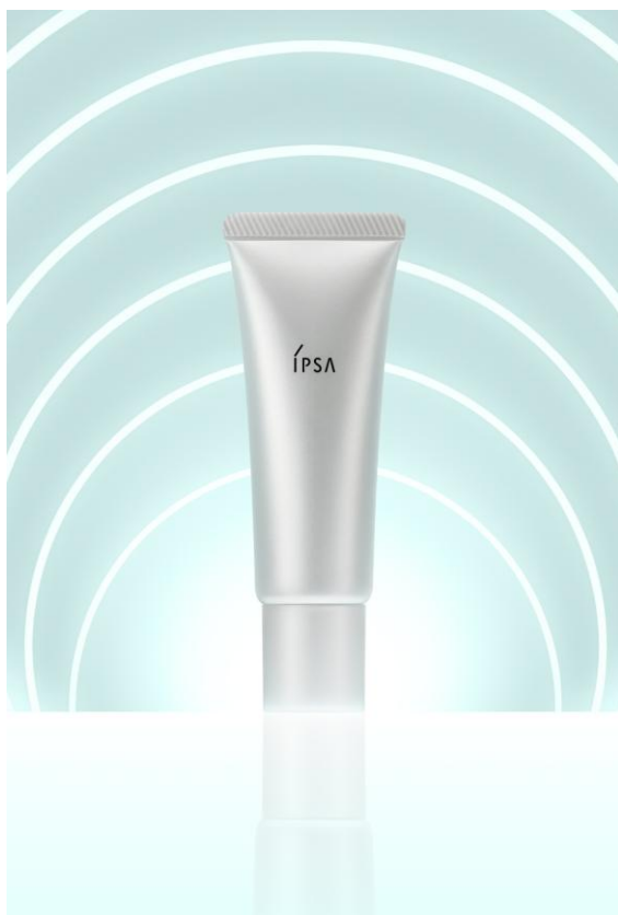
写真：イプサ ピンブルクリア e（医薬部外品）